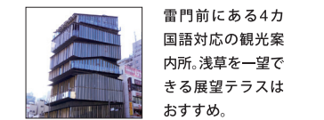
雷門前にある4カ国語対応の観光案内所。浅草を一望できる展望テラスはおすすめ。