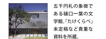
五千円札の象徴である樋口一葉の文学館。『たけくらべ』未定稿など貴重な資料を所蔵。