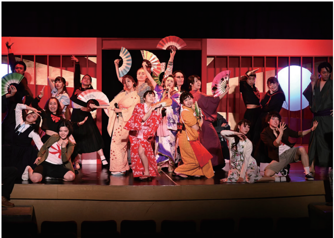
2020年2月第29回公演「色指南一飛雁家の恋一」より

場所：東洋館 申込：要「チケットの購入方法」をご覧ください。 料金：一般 5,000円 (前売 4,500円) / 学生 4,000円 (前売 3,500円) 主催：劇団ドガドガプラス