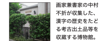
画家兼書家の中村不折が収集した、漢字の歴史をたどる考古出土品等を収蔵する博物館。