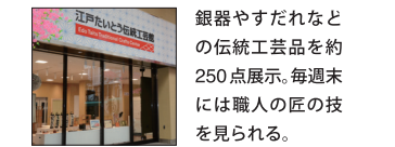
銀器やすだねなどの伝統工芸品を約250点展示。毎週末には職人の匠の技を見られる。