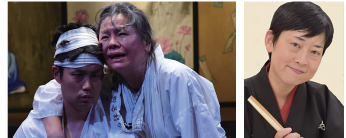
劇団権人公演「かさぶた式部考」2019年5月、撮影：宮内勝 桂右園治

場所：上野ストアハウス 申込：要「チケットの購入方法」をご覧ください。 料金：一般 5,000円 (プレビュー公演 4,000円) / 学生 2,500円 主催：劇団権人