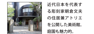
近代日本を代表する彫刻家朝倉文夫の住居兼アトリエを公開した美術館。庭園も魅力的。